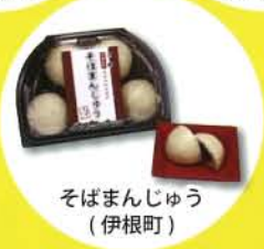
そばまんじゅう (伊根町)