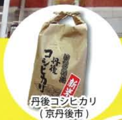
丹後コシヒカリ (京丹後市)