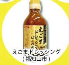
えごまドレッシング (福知山市)