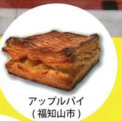
アップルパイ (福知山市)