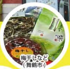
梅干しなど (舞鶴市)