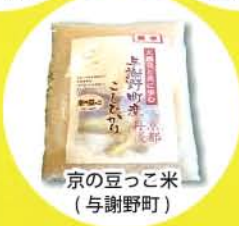
京の豆っこ米 (与謝野町)