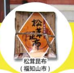
松茸昆布 (福知山市)