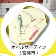
オイルサーディン (宮津市)